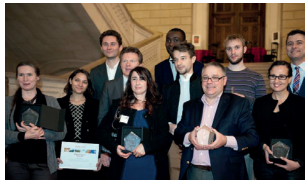
Les Lauréats 2013 du Grand Prix et des bourses d'études et de voyage

A leur retour, les lauréats sont tenus de remettre un exemplaire de leur rapport de voyage à leur tuteur en 2 exemplaires papier au Secrétariat du Mécénat, et de téléverser le même dossier dans leur espace personnel candidat en PDF (JPG pour les illustrations correspondantes). Le rapport de voyage devra présenter de manière vivante et illustrée les connaissances et impressions recueillies par le lauréat. Certains rapports, particulièrement remarquables, pourront faire l'objet d'une exposition ou d'une aide à l'édition.